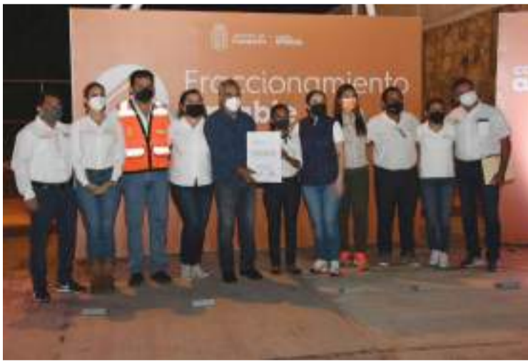
EL OBJETIVO de este programa es atender las necesidades ciudadanas y brindar servicios públicos de calidad de forma permanente.

Detalló que se realizó un trabajo previo de sondeo ciudadano para conocer las necesidades de los vecinos para poder dar atención a sus solicitudes, de esta manera se lograron trabajos de limpieza, pintura de guarniciones, poda de árboles, limpieza de áreas verdes, identificación y recuperación de