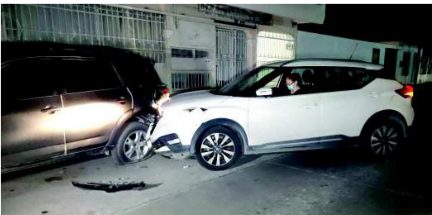
DAÑOS POR MÁS 100 mil pesos fue el saldo de un aparatoso choque, en el fraccionamiento "Justo Sierra".

Para evitar la presencia de agentes de la Policía Municipal, los involucrados en el choque decidieron llegar a un buen acuerdo por el pago de los daños a través de sus respectivas aseguradoras para evitar problemas legales.