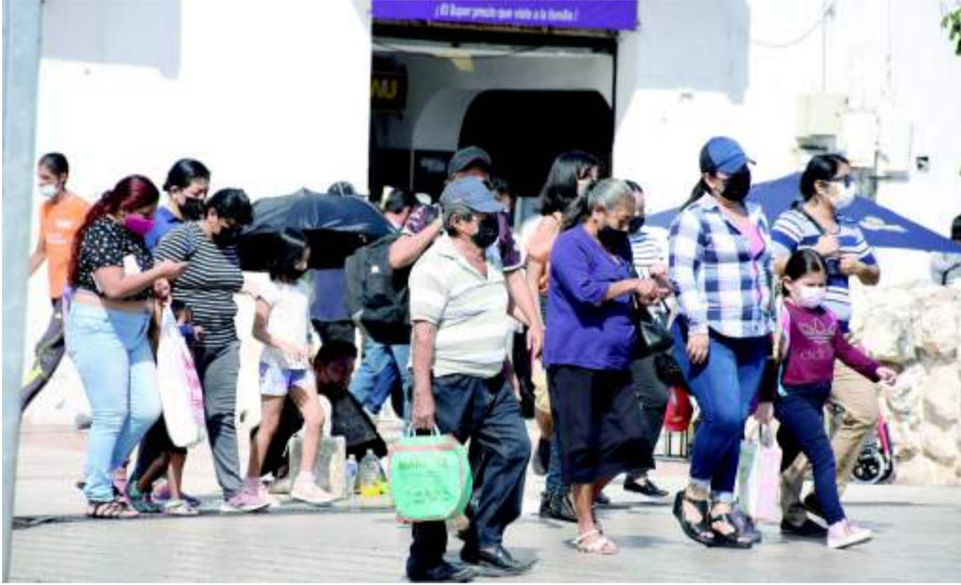
EL DÍA DE AYER se registraron 181 casos positivos de COVID-19 en el Estado, informó la Secretaría de Salud en su reporte.