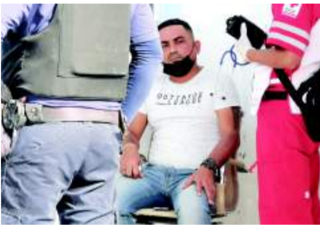
TRAS RECIBIR una llamada de intento de extorsión, una persona sufrió una crisis nerviosa.

Afortunadamente todo quedó en un susto para padre e hija, pero el afectado fue exhortado por los agentes policíacos a presentar su formal denuncia por el intento de extorsión.