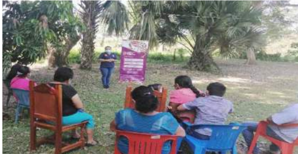
CON ESTAS pláticas, la dependencia indicó que se benefició a un total de tres mil 979 personas, de las que dos mil 555 fueron mujeres y mil 424 hombres.

Asimismo, temáticas sobre género, tipos y modalidades de la violencia, lenguaje incluyente con perspectiva de