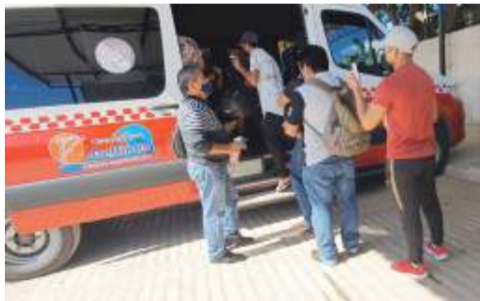
DE CONFIRMAR el IET un aumento a la tarifa, el costo del pasaje pasaría de 40 pesos a 50 por persona.

Por otro lado, de ser efectiva un alza, esta podría ser a razón de 10 pesos, es decir, el costo del pasaje de 40 pesos pasaría a 50 pesos.