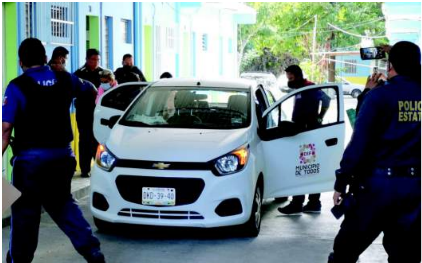
UNA MENOR fue abandonada por sus padres en el interior del cuarto de un hostel.