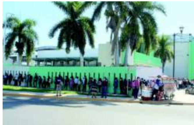
CONTINUÓ LA VACUNACIÓN contra el COVID-19 a jóvenes de entre 15 y 17 años de edad.

Mientras que el reporte de la Jornada Nacional de Vacuna-