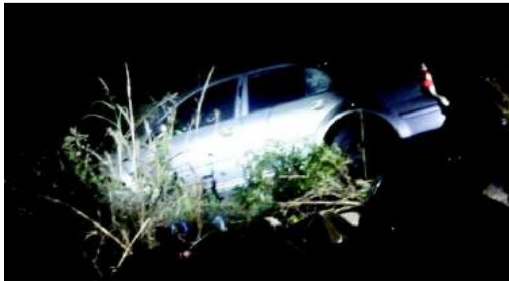
UN JETTA se salió de la carretera cuando la unidad registró un conato de incendio.