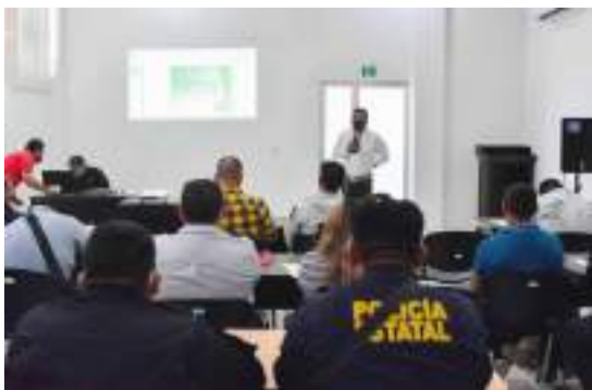
ESTÁ CAPACITACIÓN continuará durante dos meses.