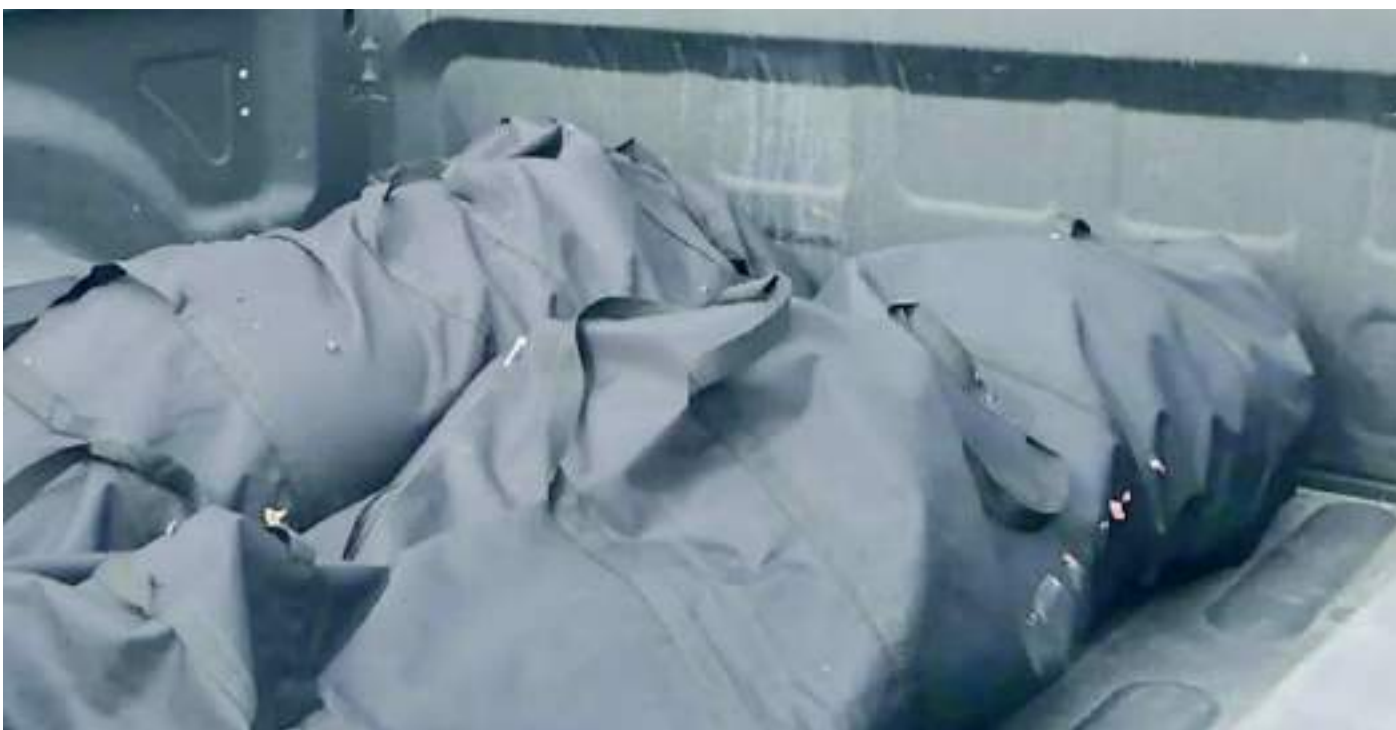
LOS DOS campesinos hallados muertos en Candelaria fueron degollados, según fuentes no oficiales.