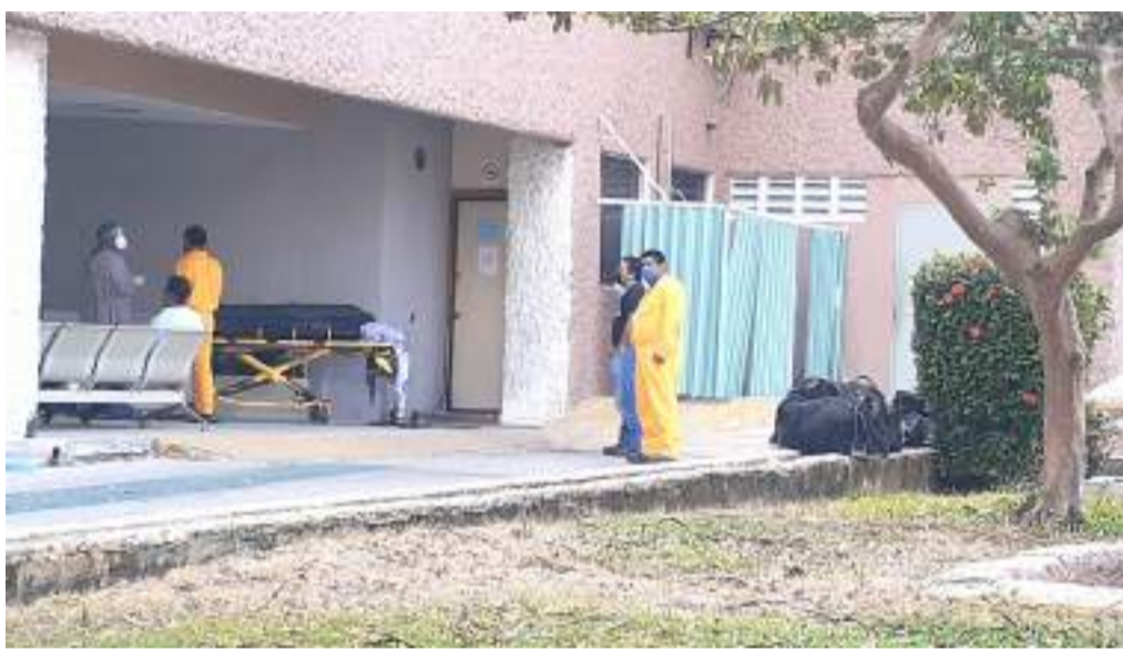
DEL INICIO DE la pandemia a la fecha, la petrolera nacional ha bajado de sus instalaciones marinas a dos mil 309 personas.

En lo que va del 2022, han sido traídos a tierra de las plataformas marinas de PEMEX 85 personas, de las cuales 59 corresponden a trabajadores de la petrolera