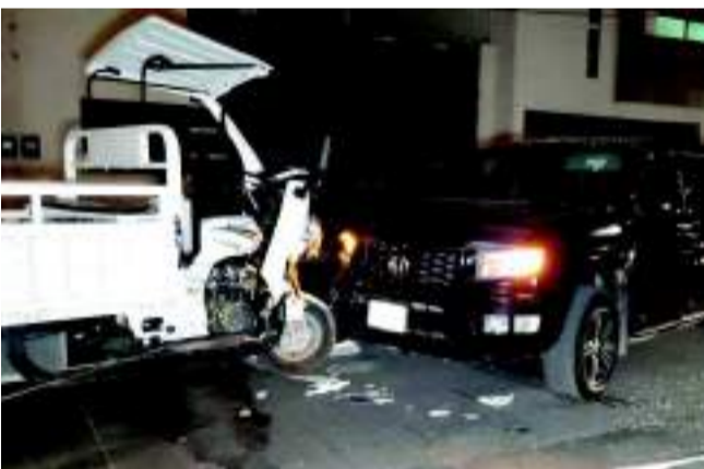
EL CONDUCTOR de una camioneta se impactó contra un "motocarro", en la colonia Bivalvo.

A pesar del impacto, el motociclista resultó con lesiones menores, que no requirieron de la presencia de socorristas de la Cruz Roja, ya que esperarían las aseguradoras para llegar a un buen acuerdo por el pago de los daños.