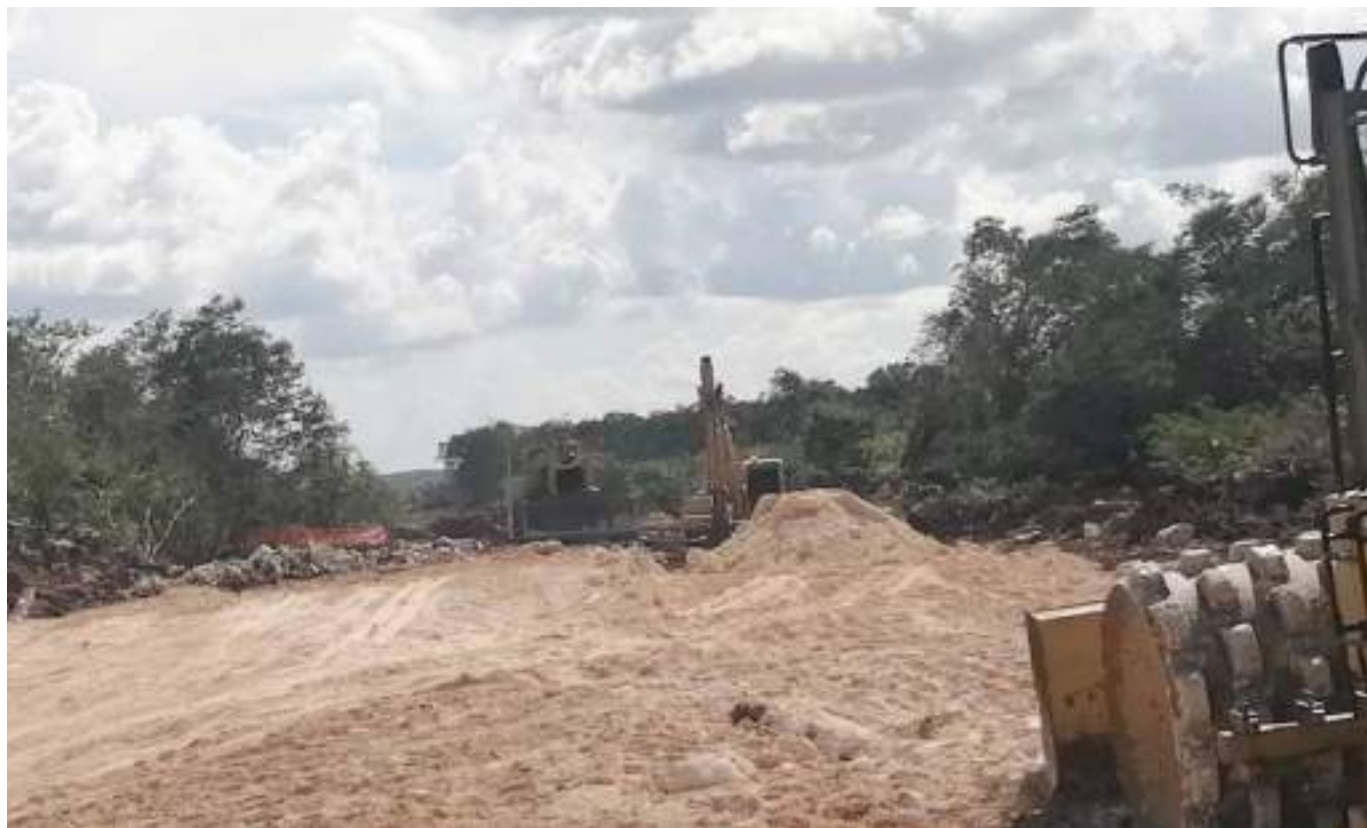
PERSONAL DEL INAH realiza la investigación de un montículo en el tramo 03 del Tren Maya, para evitar que maquinaria pesada los dañe.

Así, el riesgo de contraer la enfermedad se reducirá considerablemente, y esperamos, que las autoridades educativas actúen con responsabilidad, no por cuestiones políticas, porque la salud no tiene nada que ver con ese tipo de problemas. La gente creyó en que las cosas serían diferentes, pero, ven que estamos peor que antes, indicaron.