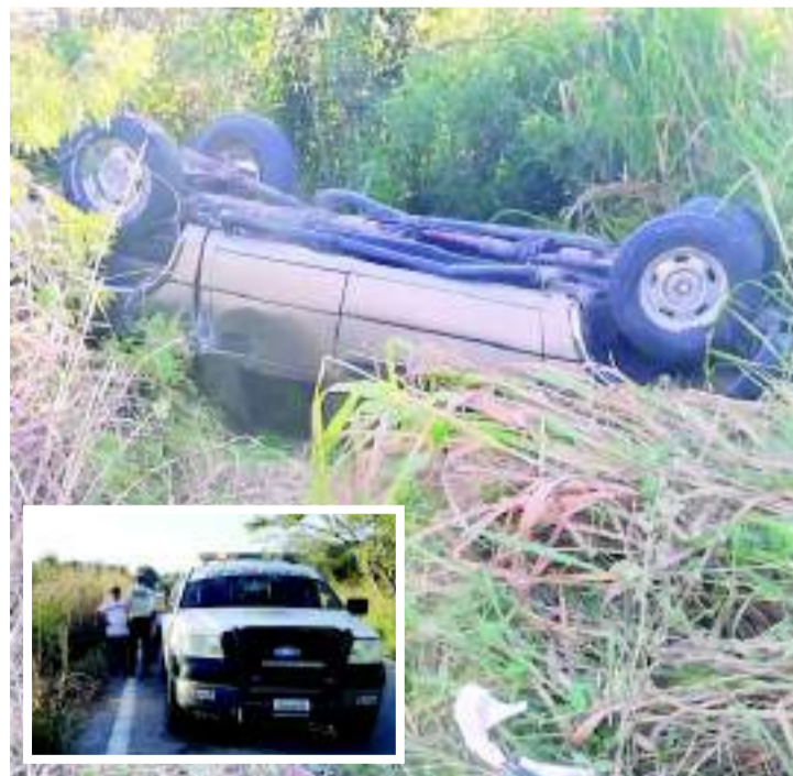
UNA PAREJA terminó lesionada al volcarse en una camioneta.

Al lugar arribó una patrulla de la Guardia Nacional, cuyos oficiales se hicieron cargo del caso para las diligencias necesarias y remolcar el vehículo.