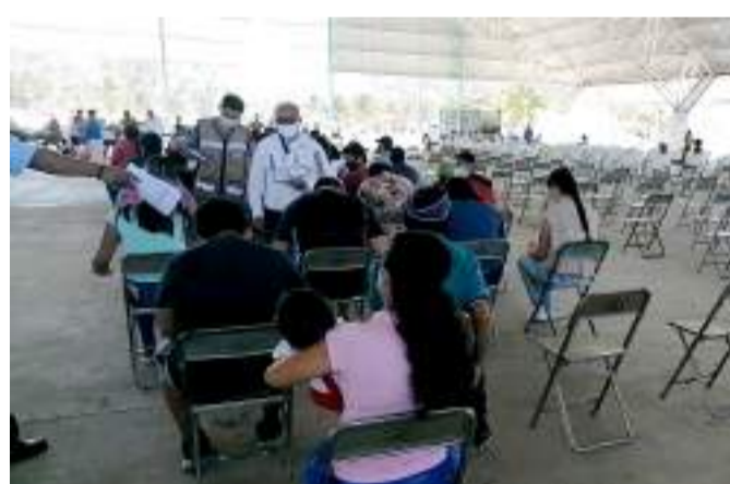
AYER DURANTE EL segundo día de inmunización a jóvenes de 15 a 17 se tuvo una asistencia de tres mil 200 personas.

De acuerdo a Vicente Guerrero del Rivero, director regional de Programas para el Bienestar, para este viernes se espera que la demanda pueda ser un poco mayor al ser el último día de la jornada,