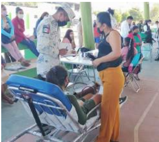
EN EL SEGUNDO día de inoculación a jóvenes de 15 a 17 años, se vio mayor afluencia, puesto que hasta las tres de la tarde ya se habían vacunado un total de 540 menores.

na promedio es de 100 pesos a 130 pesos, Jarabe Ambroxol ronda los 104 a 150 pesos, según el campesino, en todas las farmacias entrevistadas ya están previendo por el alza de casos el pedido extraordinario para surtir y tenerlo ante las emergencias.