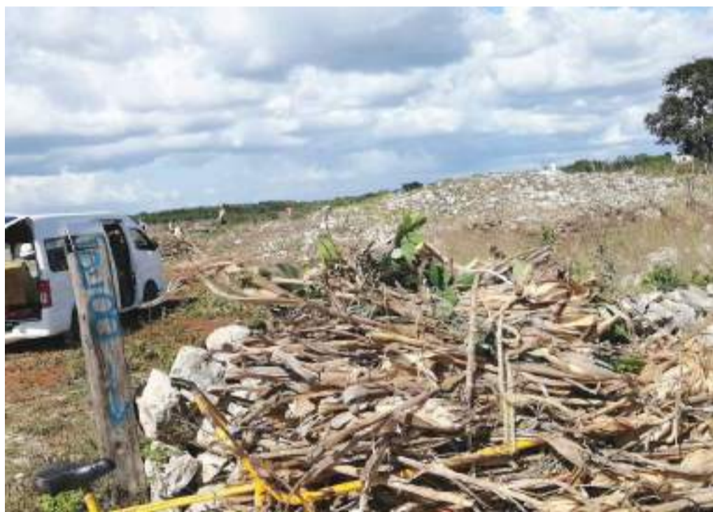
ESTA NUEVA ruta del Tren Maya atravesará, milpas, ranchos, y montes altos.

Esta nueva ruta del Tren Maya atravesará, milpas, ranchos, y montes altos