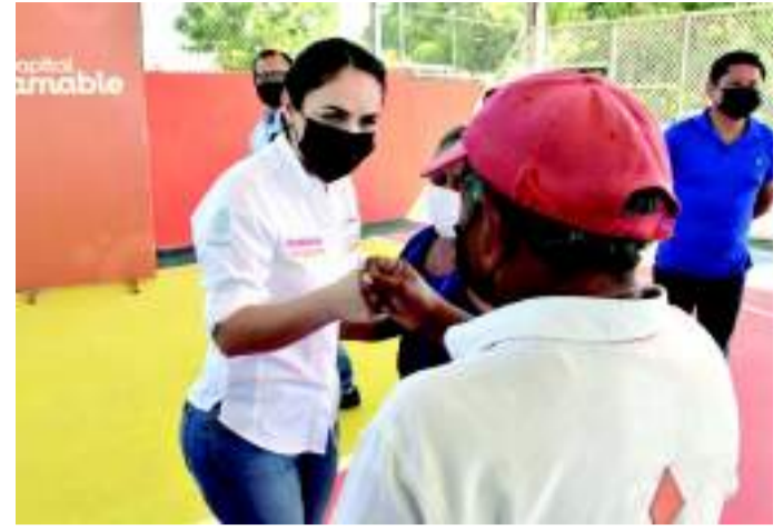
LA ALCALDESA de Campeche, Biby Rabelo de la Torre.

ción para adolescentes de 15 a 17 años el primer día tres mil 402 dosis aplicadas, las cuales se repartieron en los Municipios de: Calakmul, 222 dosis; Hopolchén, 426; Tenabo, 294 y Hecelchakán, 708.